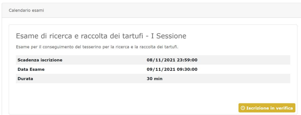
Figura 6 - Iscrizione in verifica

In attesa dell'abilitazione, il sistema presenta lo status "Iscrizione in verifica" in corrispondenza della sessione d'esame prenotata: