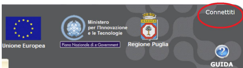
Figura 1 - Link Connettiti

Effettuata la connessione al portale web http://www.sit.puglia.it , cliccare sul link "Connettiti" come evidenziato nella seguente figura: